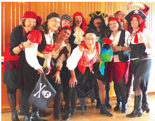
„Die Piraten“ von Jennifer Mikulla