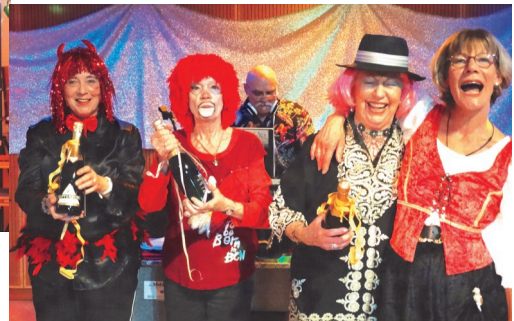
Die Prämierung der Masken